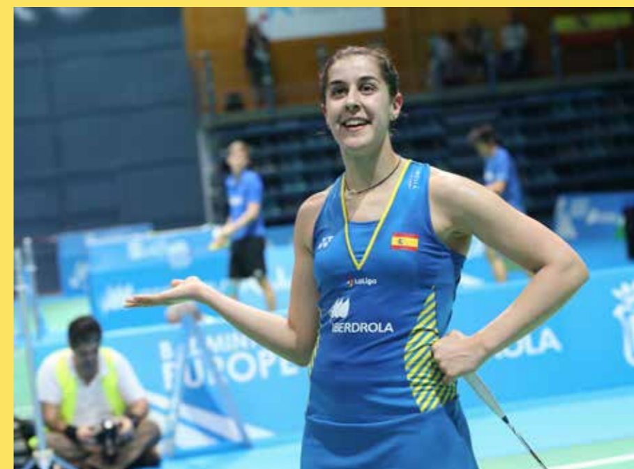
Carolina Marin slaví. Stala se trojnásobnou světovou šampionkou

Na přelomu července a srpna se v čínském Nanjingu odehrál badmintonový světový šampionát, jehož hlavní hvězdou se stala Carolina Marin. Španělská hráčka se postarala o ojedinělý historický zápis a stala se první ženou, která v singlu získala tři tituly světové šampionky. „Je to opravdu speciální chvíle,“ prohlásila spokojená pětadvacetiletá Španělka, která získala světové tituly už v letech 2014 a 2015. K tomu poslednímu došla po finálové výhře nad indickou soupeřkou a světovou trojkou P. V. Sindhu, se kterou si tak zopakovala finálovou bitvu z olympijského turnaje v Riu de Janeiro. I tehdy se radovala Marin, Sindhu však nyní věřila v úspěšný reparát. „Už jsme proti sobě hrály hodněkrát, znám její hru. Doufám, že vybojuju zlato,“ hlásila před letošní bitvou. V Číně ale opět zvítězila Španělka, která vyhrála 21:19 a 21:10. Zklamaná Sindhu tak skončila, stejně jako před rokem v Glasgow, těsně pod nejvyšším stupínkem. Velkým překvapením turnaje byl výkon domácí Tai Tzu Ying, která dohrála už ve čtvrtfinále. Šampionka Marin se na šampionátu stala zároveň jediným medailistou z Evropy. Nehodlá však polevit a věří v další úspěchy. „Já, Carolina Marin, se vrátím a budu bojovat o další cíle,“ vyhlásila odhodlaně po turnaji.