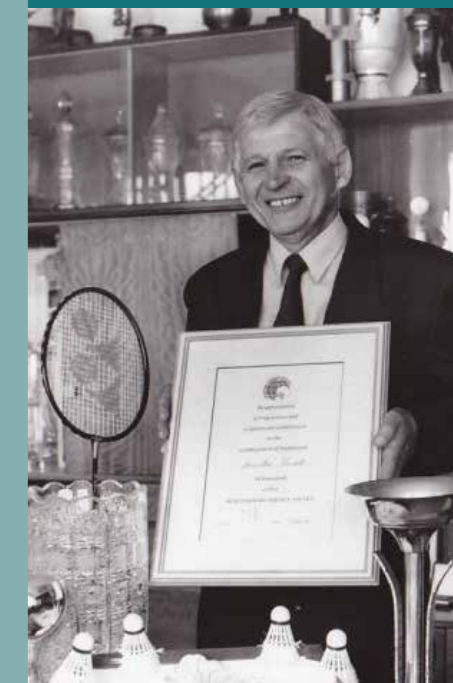
S ocenením od svetovej bedmintonovej federácie IBF v roku 1999 za prínos k rozvoju svetového bedmintonu.