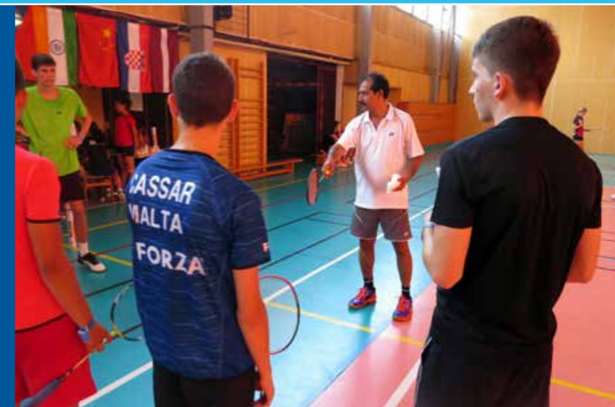
14. ročník mezinárodního kempu v Mostě vedli špičkoví světoví trenéři