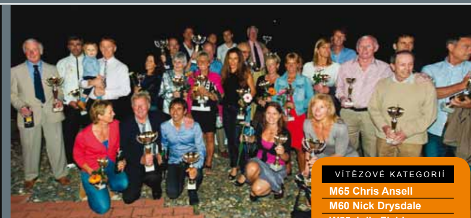
Skupinová fotografie všech vítězů