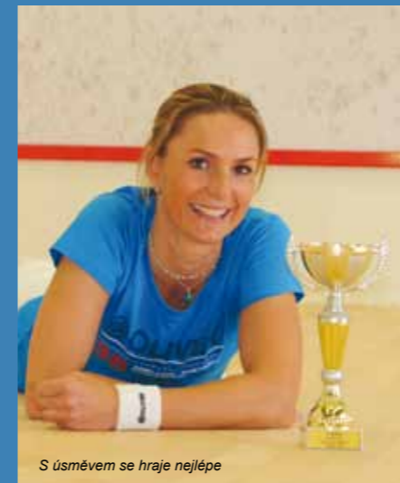
S úsměvem se hraje nejlépe

Co Vás čeká v blízké době? Chystáte se na nějaký turnaj?