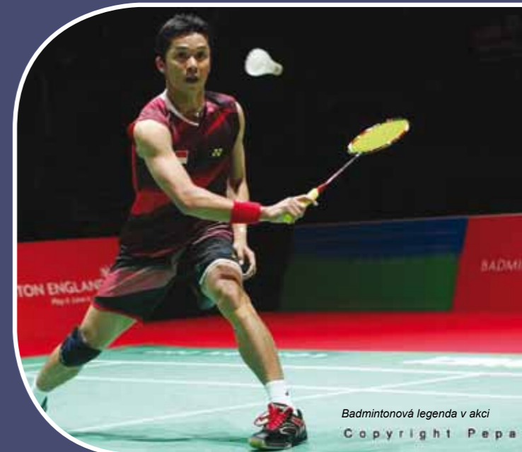
Badmintonová legenda v akci