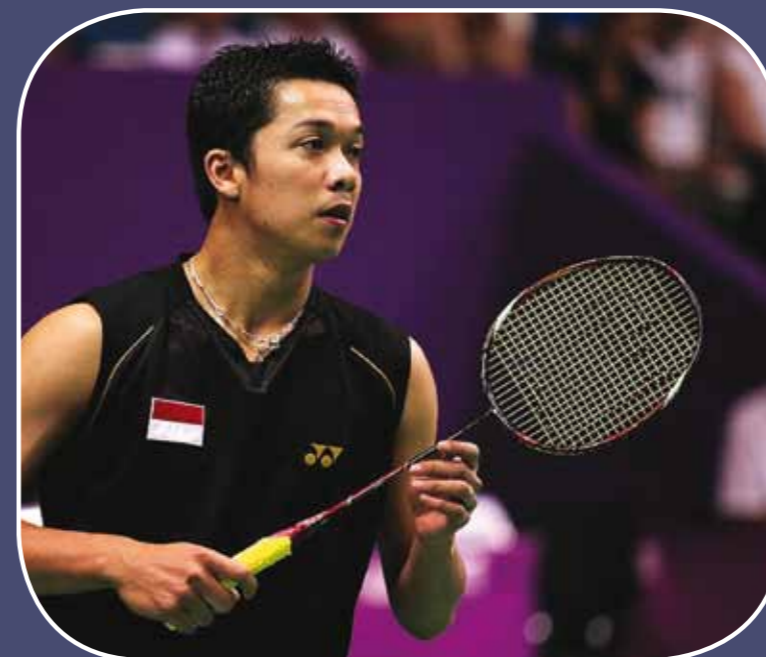
Taufik Hidayat ukončil svou kariéru

Tontowi Ahmad, Liliyana Natsir (Indonésie) vs. Xu Chen, Ma Jin (Čína) 21:13, 16:21 a 22:20