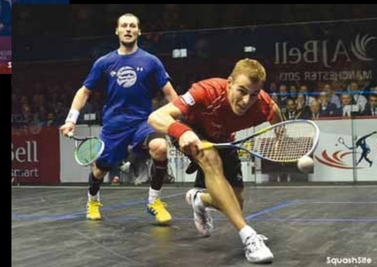
Matthew bojuje v Manchesteru o medaili.