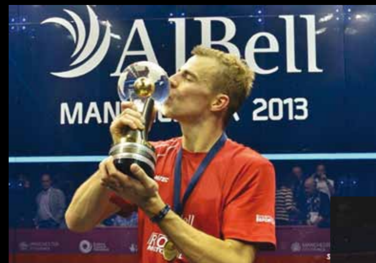
Nick Matthew vyhrál na přelomu října a listopadu 2013 turnaj AJ Bell World Squash Championship v Manchesteru.